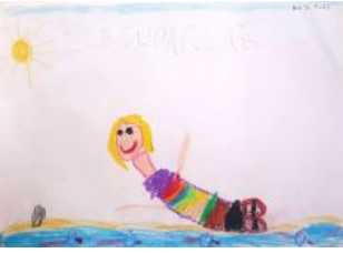
Ece Su Parlak