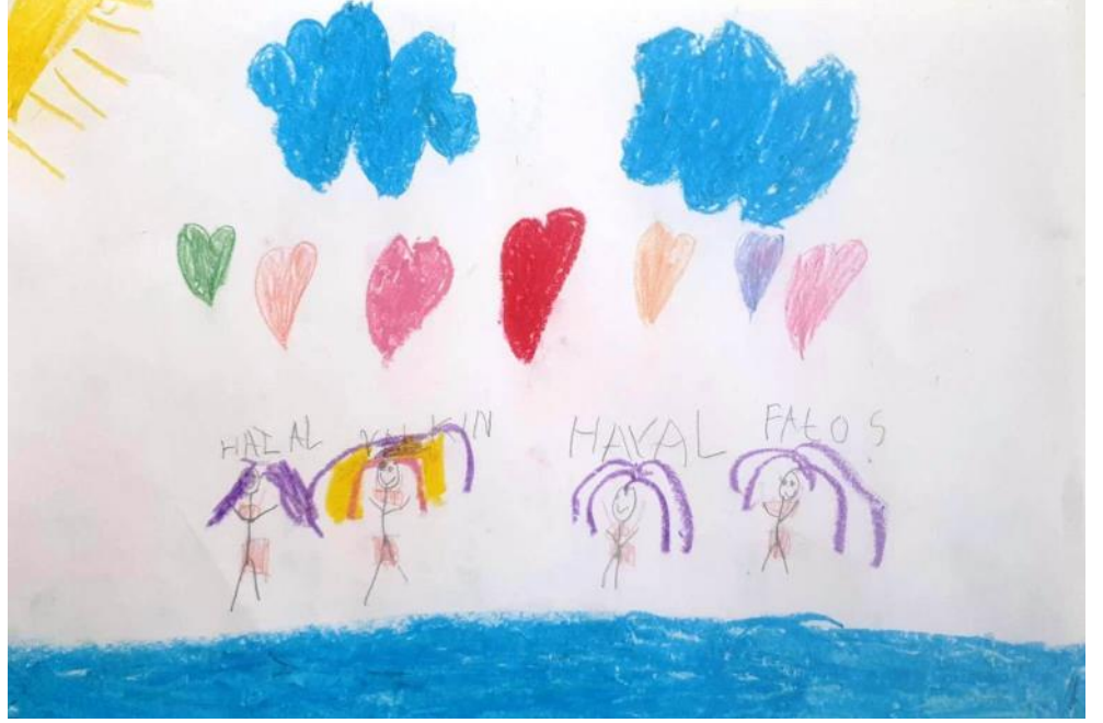
Kapak Resmi: Yalkın Can