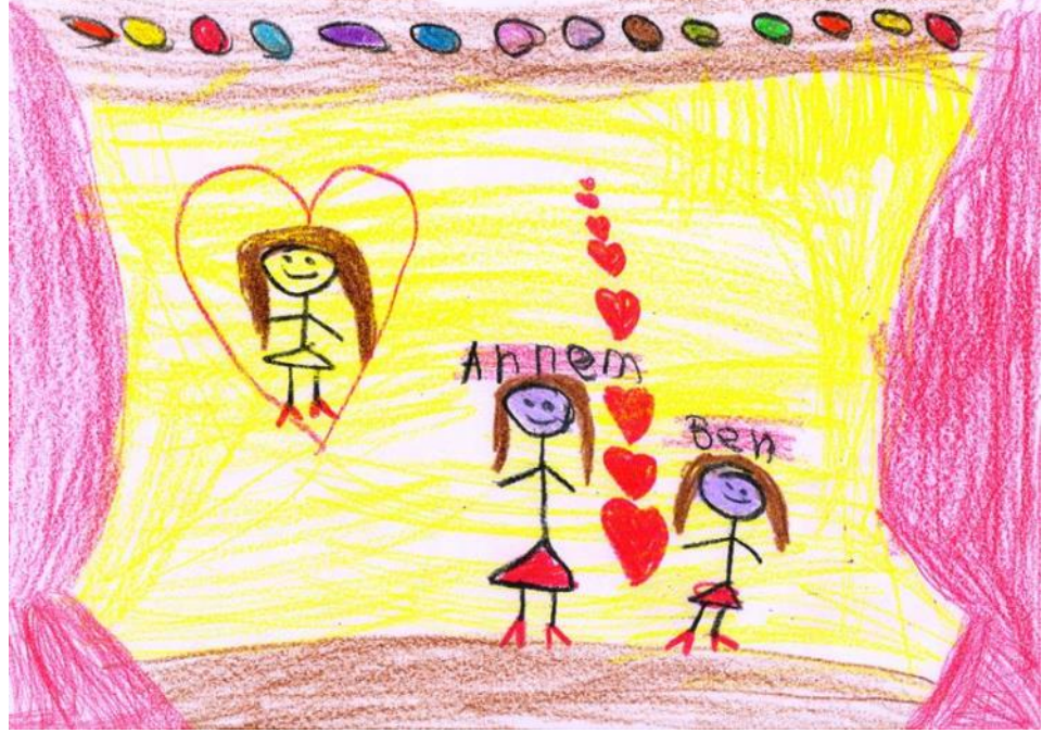
Kapak Resmi: Deren Halil