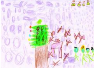
Servet Ensar Şahan