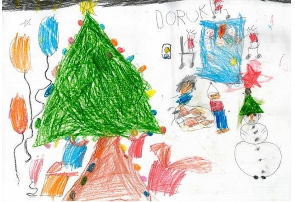
Kapak Resmi: Doruk Uluel