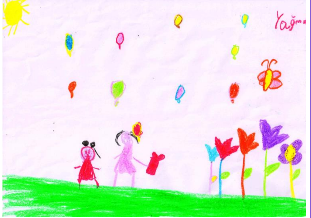
Kapak Resmi: Yağmur Erbekir, 5 y.